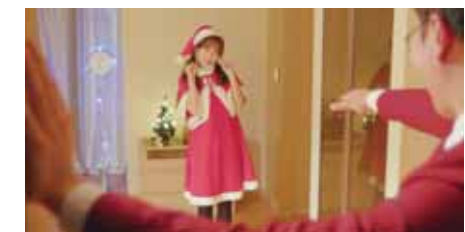
EP#15 'BLACK CHRISTMAS' 예기치 못한 정전으로 뜻밖의 사건을 겪으면서 생각하게 되는 크리스마스의 진짜 의미.